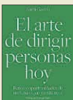
El arte de dirigir personas hoy Santi García Libros de Cabecera 18,00 euros 228 páginas

Y desde luego, ¿por qué no se ha destacado que fue un institucionista muy importante e influido por el krausismo?