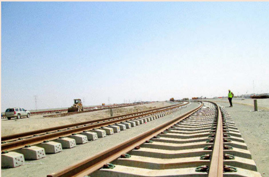
Obras del corredor de alta velocidad entre las ciudades santas de Medina y La Meca.